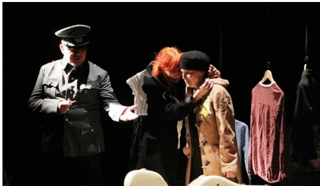
Eli Eli lama sabachtani – Divadlo ASI