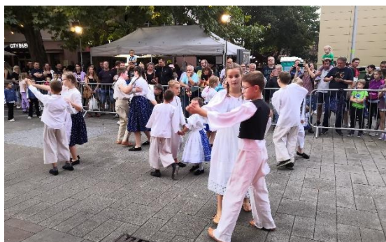
Beh nočnou Šaľou