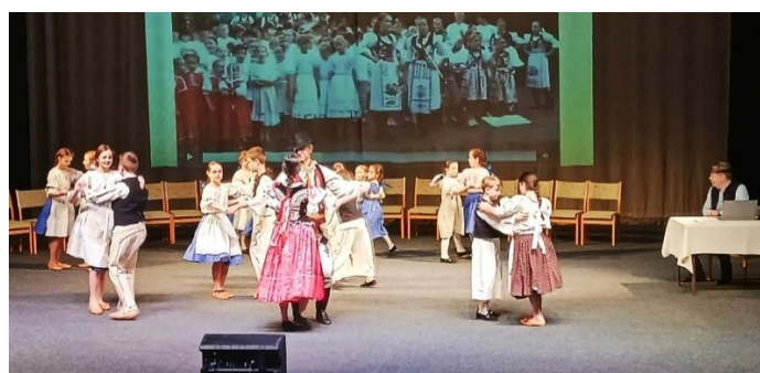
ZUŠ Výchovný koncert