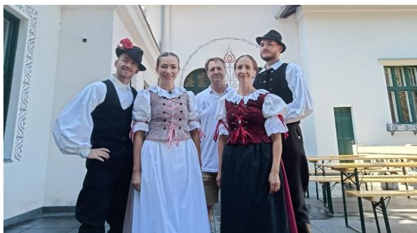
Deň Baníkov, Tatabánya, HU