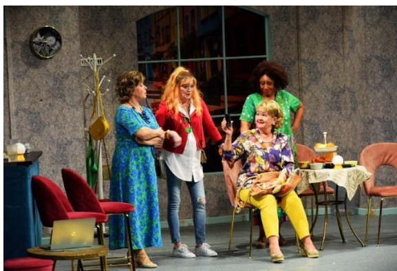
Klimaktérium - Divadlo komédie