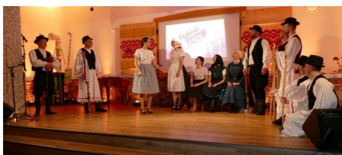
Gajdošské fašiangy Jedľové Kostolany