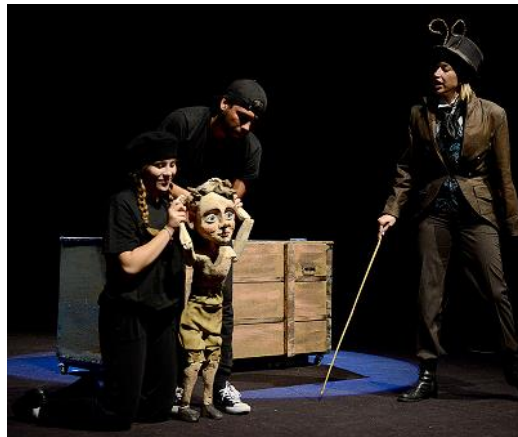
Divadlo Materinky – Pinocchio