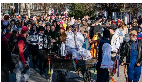
Fašiangový sprievod Šaľa