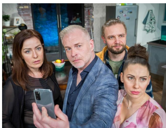
2:22 Príbeh duchov - Divadlo Komédie

Celkovo bol pre MsKS na rok 2025 schválený rozpočet vo výške 246 790,- EUR, po zmenách v sume 240 533,- EUR. V roku 2025 sa celkom na činnosť MsKS vyčerpalo 213 918,- EUR (v čom sú okrem samotných kultúrnych podujatí zarátané aj výdavky na všeobecný materiál potrebný na propagáciu, ako aj na samotnú činnosť, PHM, všeobecné služby, prepravné náklady, reprezentačné výdaje a pod.) – čím sa z upraveného rozpočtu vyčerpalo 88,9 %.