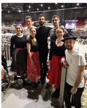
Tanečný dom, HU