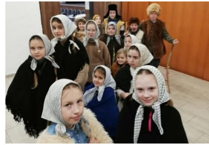
Vianočný program Veča