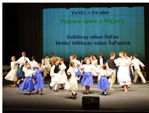
Výchovný koncert MŠ