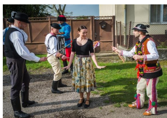
Tradiície Veľkej noci, Šaľa a okolie