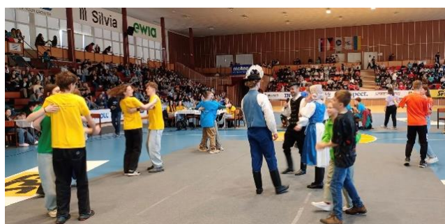
Ukáž čo vieš