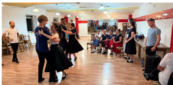
Sústredenie na súťaž, Radava