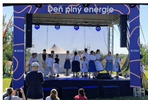
Dni plné energie, Kráľová n/V