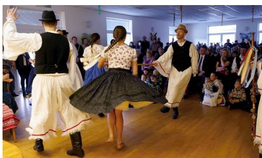
Gajdošské fašiangy Veľká Lehota