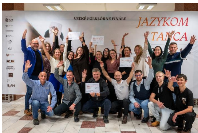
Celoštátne kolo Jazykom tanca, Banská Bystrica