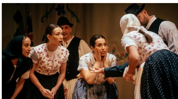
Gajdošské fašiangy Malá Lehota