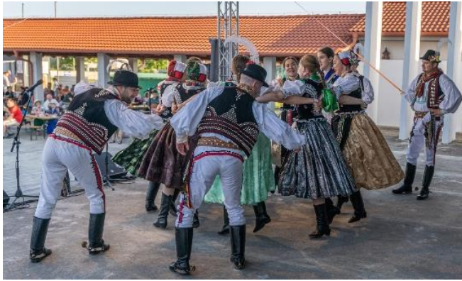
Vlčianske folklórne slávnosti