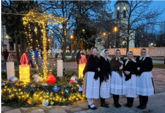
Druhá adventná svieca