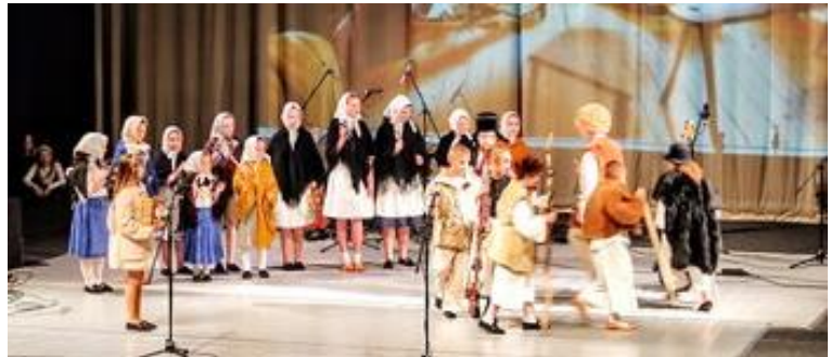
ZUŠ Vianočný koncert