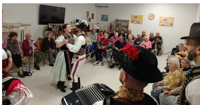
Domov dôchodcov Šaľa