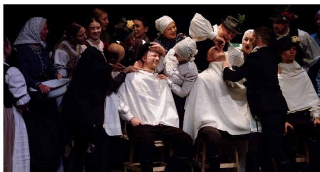
Krajské kolo Jazykom tanca, Šaľa