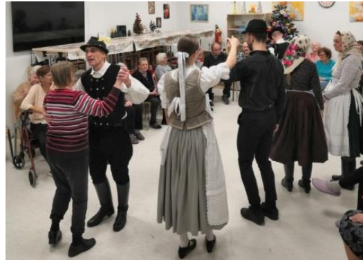
Domov dôchodcov Šaľa