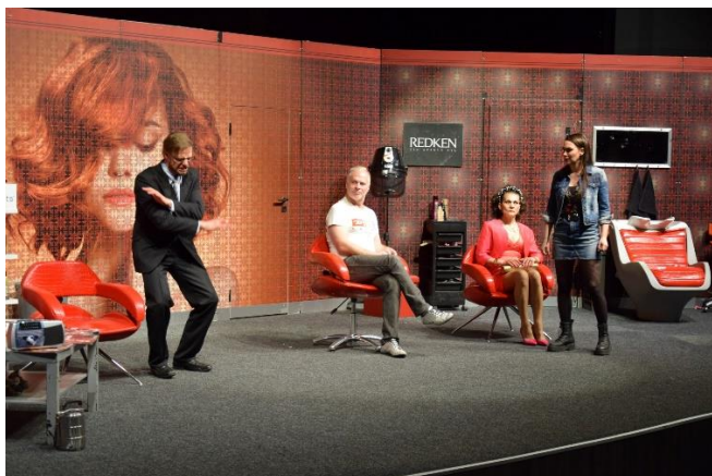
Šialené nožničky - Lento