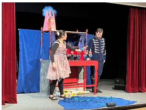
Statočný cínový vojačik – Babadlo