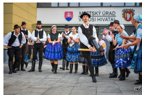
Verejná ochutnávka vín