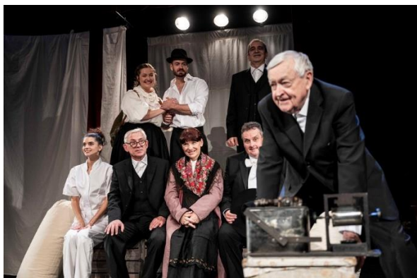
Ako sme sa hľadali – RND