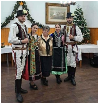
Deň Oroszlánskych Slovákov, HU