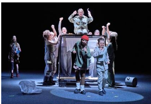
Zlodejka kníh - Zlatá priadka