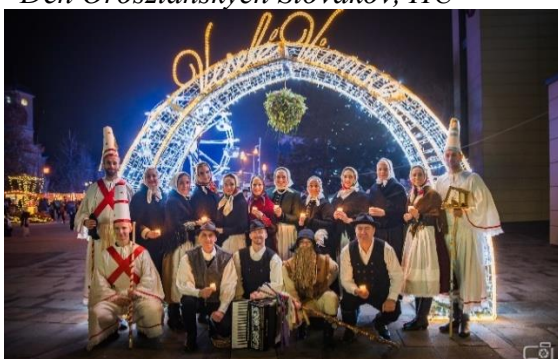
Vianočný program Šaľa