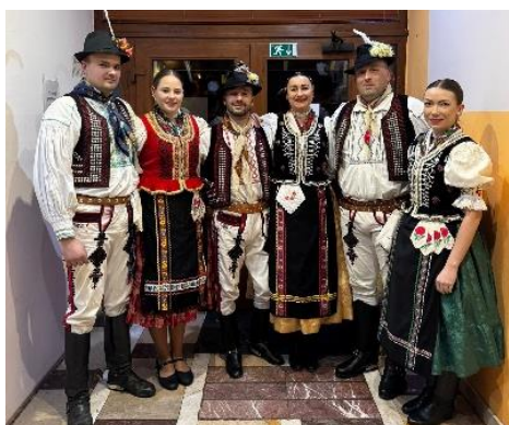
Matičný ples Šaľa