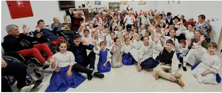
Domov dôchodcov Šaľa